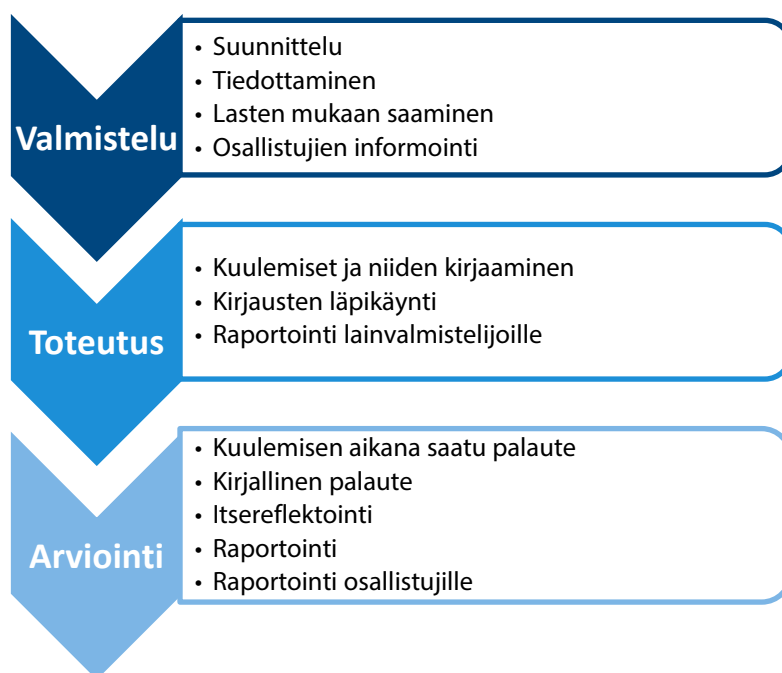
Kuvio 3. Lasten kuulemisen toteuttaminen vaiheittain.

Valmistautuminen lasten kuulemiseen etenee pääpiirteissään kuviossa 3 esitetyn kaavan mukaisesti: