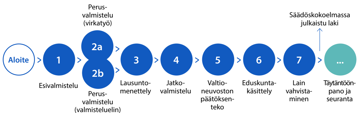
Kuvio 1. Lainvalmistelun prosessikuvaus 14 .

Kuulemisessa on merkityksellistä pohtia, millainen kuulemisen muoto ja laajuus on riittävä kuhunkin lainvalmistelun vaiheeseen. Menetelmät valitaan hankkeen laajuuden, tavoitteiden ja tavoiteltavien osallistujien perusteella. Kaikissa kuulemisen muotojen ja organisoinnin tavoissa on huomioitava lasten etu ja saavutettavien lapsiryhmien mahdollisuudet tasapuoliseen osallistumiseen. Käytännössä tämä voi tarkoittaa esimerkiksi viittomakielestä huolehtimista tai selkokieliisyyttä. On myös hyvä huomioida, että osa lapsista saattaa tarvita aikuisen tukea osallistumista varten.